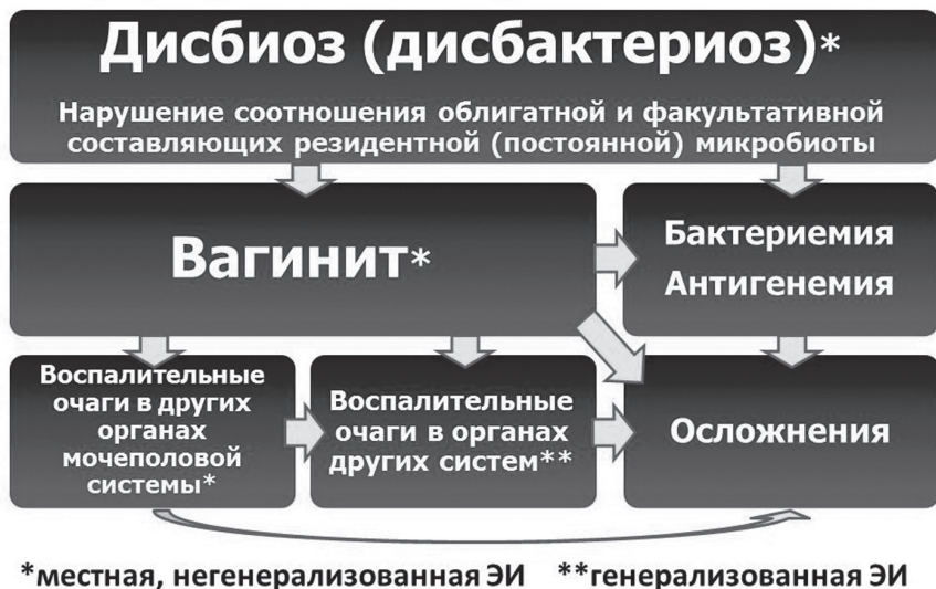
Рис. 2. Этапность формирования эндогенной инфекции у женщин

При этом могут иметь место иммунопатологический и антиапоптозный эффекты, а также хромосомные aberrации, связанные с некоторыми представителями факультативной микробиоты (в частности с микоплазмами), приводящие к формированию аутоиммунных реакций, опухолевой трансформации и присоединению вторичной инфекции.