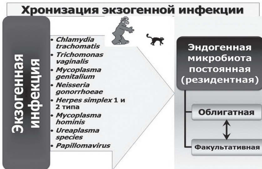
Рис. 3. Взаимодействие экзогенной половой инфекции с эндогенной микробиотой влагалища

В дальнейшем при хронизации экзогенной половой инфекции (примерно через 6 мес после инфицирования независимо от наличия или отсутствия терапии) такие патогены, как Chlamydia trachomatis , Trichomonas vaginalis , Mycoplasma genitalium , Neisseria gonorrhoeae , Herpes simplex 1 и 2 типа, Papillomavirus и другие, наряду с Mycoplasma hominis , Ureaplasma species и грибами рода Candida , могут находиться в составе факультативной условно-патогенной микробиоты вагинального биотопа со всеми особенностями их влияния на местный микробиоценоз. При этом чаще всего (особенно после лечения) хламидийная, герпетическая и папилломавирусная инфекции могут находиться в латентной форме, а трихомонадная, нейссерияльная и микоплазменная ( Mycoplasma genitalium ) – в виде носительства. При снижении иммунорезистентности всегда имеется потенциальная вероятность их активации. В этом случае они ведут себя как эндогенные инфекции со всем разнообразием их влияния на микрофлору влагалища. В пользу данного аргумента свидетельствует пожизненная персистенция (латенция, сочетающаяся с периодами манифестации) облигатных внутриклеточных паразитов (вирусов и хламидий) в макроорганизме